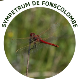
SYMPETRUM DE FONSCOLOMBE