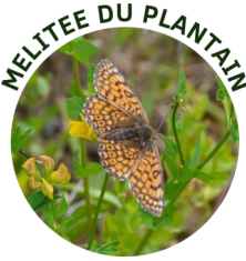
MELITEE DU PLANTAIN