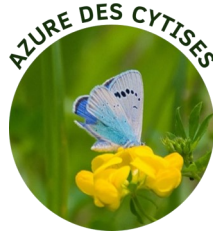
AZURE DES CYTISES