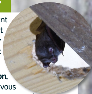
Photo couverture : Grand murin - Quentin Escolar - CEN Nouvelle-Aquitaine Photo SOS : Petit rhinolophe - Alexis Bataille - Arto Vivi

En cas de problèmes de cohabitation , des solutions existent, rapprochez vous du SOS Chauves-souris pour être accompagné gratuitement pas des spécialistes : soschauvessouris.aquitaine@gmail.com quent471@hotmail.fr (en Lot-et-Garonne)